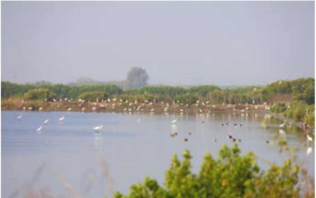
城西追鳥漫漫騎體驗活動

這是台江國家公園將魚塢營造成生態友善棲地的保育策略，讓漁民與鳥類化敵為友，自 2019 年起至 2022 年，我們已成功邀請到 32 位漁民，提供約 61.95 公頃以上魚塢成為黑面琵鷺的友善棲地。最令人感動的是！有越來越多漁民願投身保育行列！