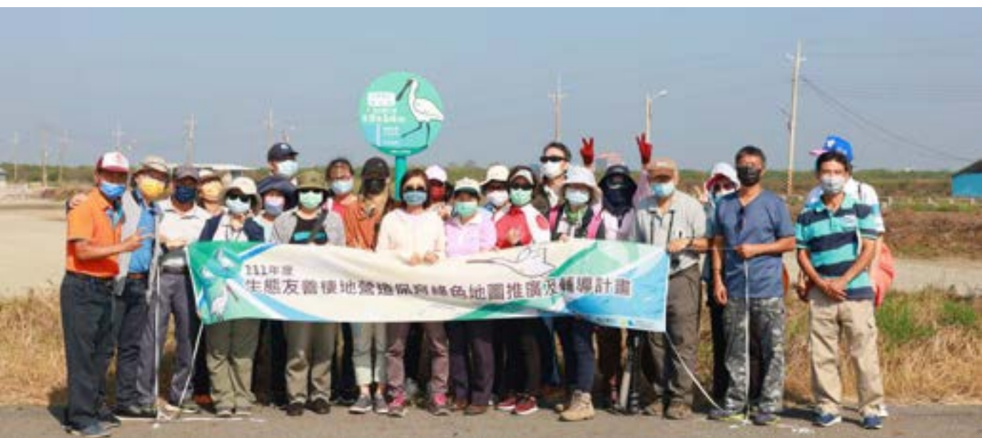
城西追鳥漫漫騎體驗活動

什麼是黑面琵鷺的生態友善棲地營造呢？透過與漁民溝通，在不過度打擾漁民生產的前提下，讓漁民在漁獲收成後，於每年十月至隔年四月候鳥度冬期間配合操作，以連續五天以上將水位維持 20~30 公分、不收下雜魚、不驅趕鳥類、不使用化學藥劑等友善措施，營造友善冬候鳥的棲地與覓食環境，在漁民完成上述操作後，台江國家公園便會提供漁民每公頃 5000 元的生態服務津貼，以獎勵漁民們提供這麼棒的生態服務。