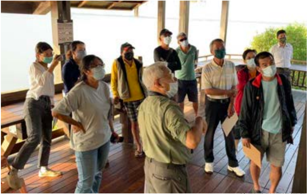
漁民聆聽鳥調課程