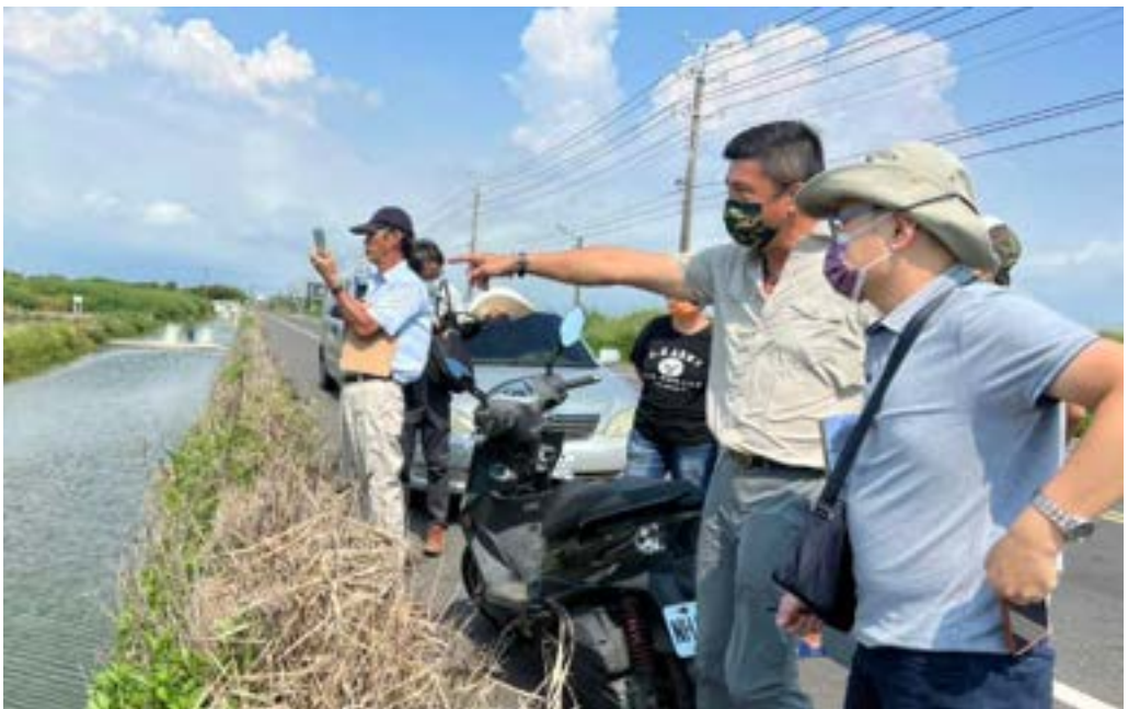
生態友善棲地魚塢訪視

這是台江國家公園將魚塢營造成生態友善棲地的保育策略，讓漁民與鳥類化敵為友，自 2019 年起至 2022 年，我們已成功邀請到 32 位漁民，提供約 61.95 公頃以上魚塢成為黑面琵鷺的友善棲地。最令人感動的是！有越來越多漁民願投身保育行列！