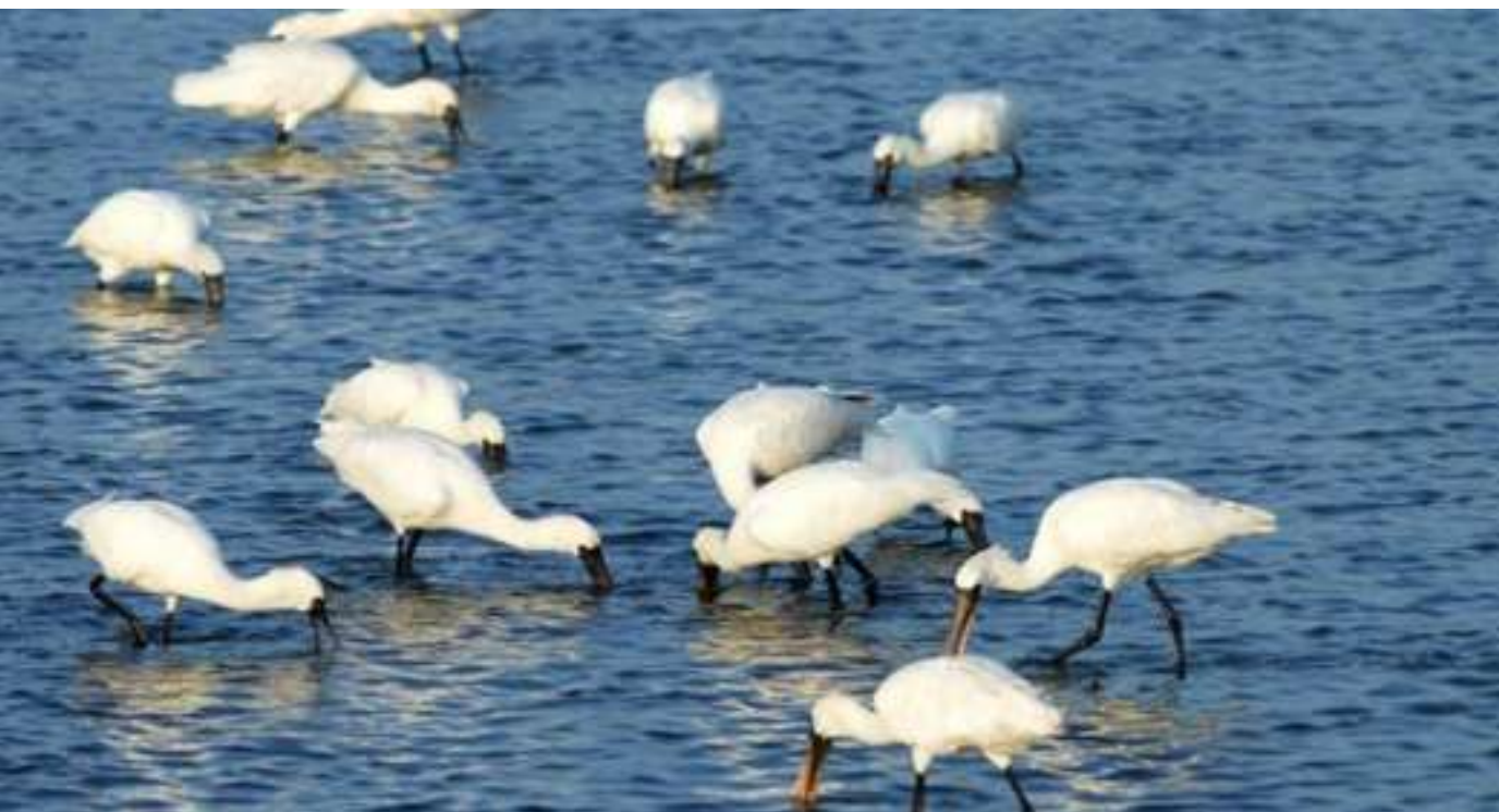
數位藝廊 / 台江國家公園